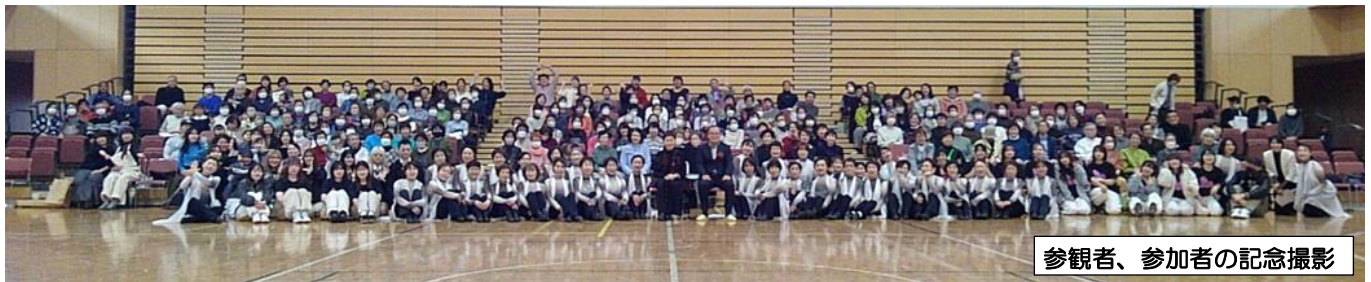
参観者、参加者の記念撮影

それぞれの曲、振付け、衣装どれも見ごたえありました。参加の先生方の熱意を感じました。