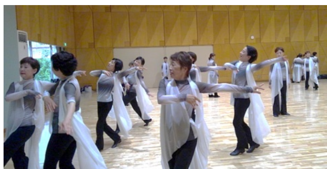
⑦ グループごとに動きを確認していきます。