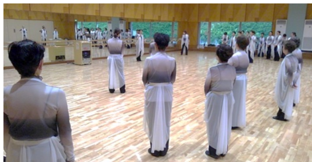
⑧ 安理先生より、全体の動きへの指示が出ます。