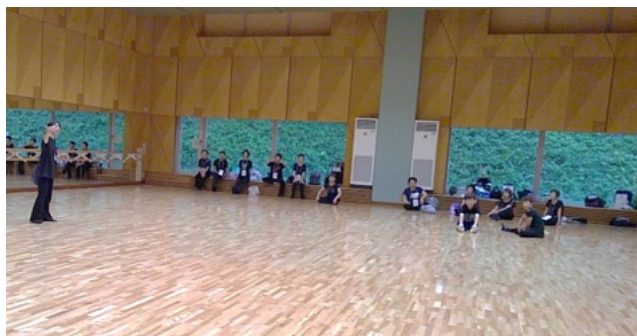
② 4体に荷物を置き、本日の流れを確認します。