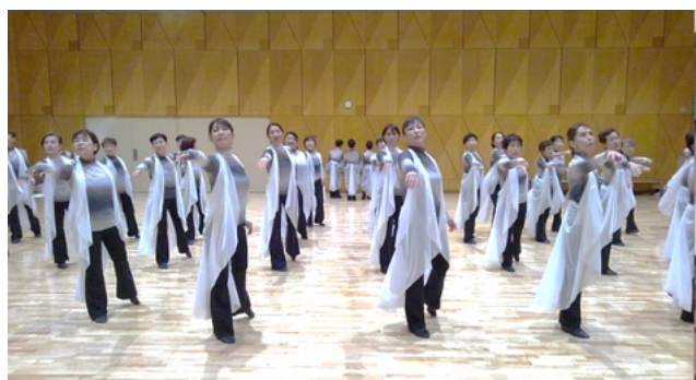
⑨ 細部まで注意が払われ、完成度が高まります。