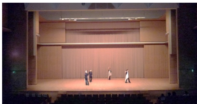
④ リハーサル。修正点も出てきたようです。