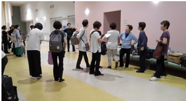
① 4体前に皆さんが集合します。