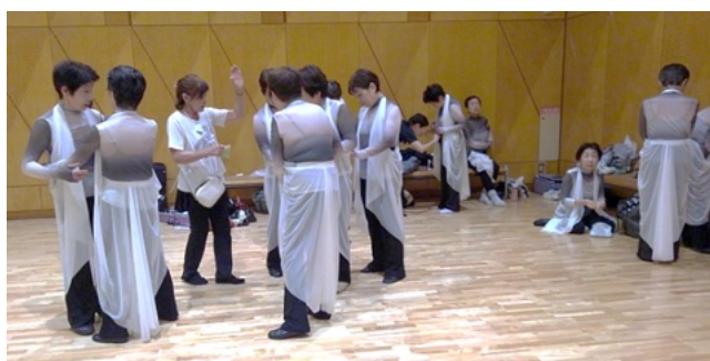
⑥ 4体で衣装に着替え、入念に衣装をチェック。