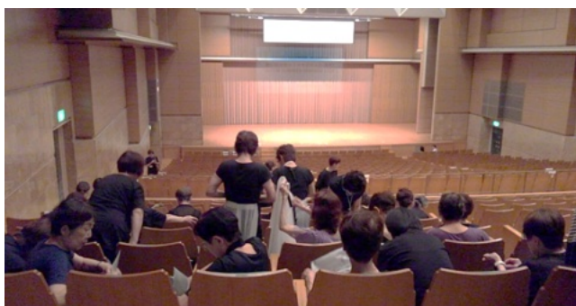
③ 大ホールに移動し、リハーサル準備。