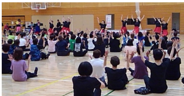
⑤ 「全員で踊り合おう」の講義にも意欲的に参加。